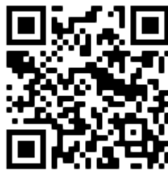
Nummer gg. Kummer